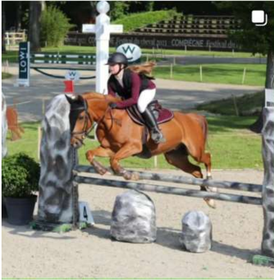
Retour sur le dernier jour de l'Open Régional 2023