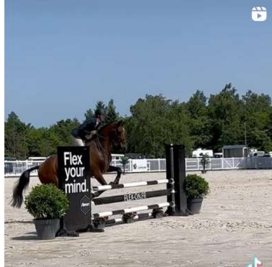
Recap de l'Open Hauts de France